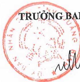
PHÓ CHỦ TỊCH UBND TỈNH Hồ An Phong